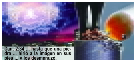
Dan. 2:34 ... hasta que una piedra ... hirió a la imagen en sus pies ... y los desmenuó.

El profeta Daniel vio que en aquel tiempo cuando el hombre tratara de unir las Naciones de Europa y el mundo sería visitado cada vez más por catástrofes y guerras; una gran piedra chocará a la imagen en los pies y la destruirá por completo. Esa piedra representa la 2ª Venida de Jesucristo (Dan. 2:34-35, 44; Salmos 18:31). Cristo pronto volverá sobre las nubes del cielo con sus ángeles, visible para toda la humanidad (Ap. 1:7). A favor de preparar a la especie humana para este evento y ayudarla a estar en pie durante el juicio; Dios, en su gran amor, advierte a la humanidad con un último mensaje de gracia que se encuentra en Apocalipsis 14:6-12.